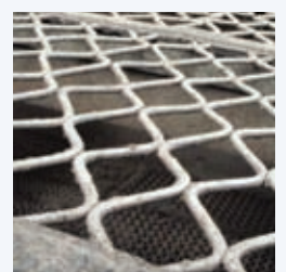
FOT. 5 Sita harfowe typu K