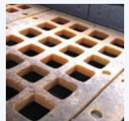
FOT. 3 Sita poliuretanowe modułowe Pro-MAT®